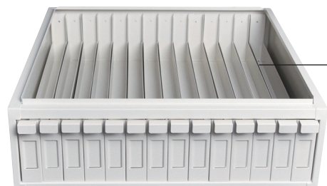
Module pour lames