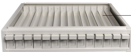
Module pour blocs de paraffine