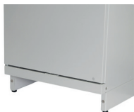
socle sans plinthe